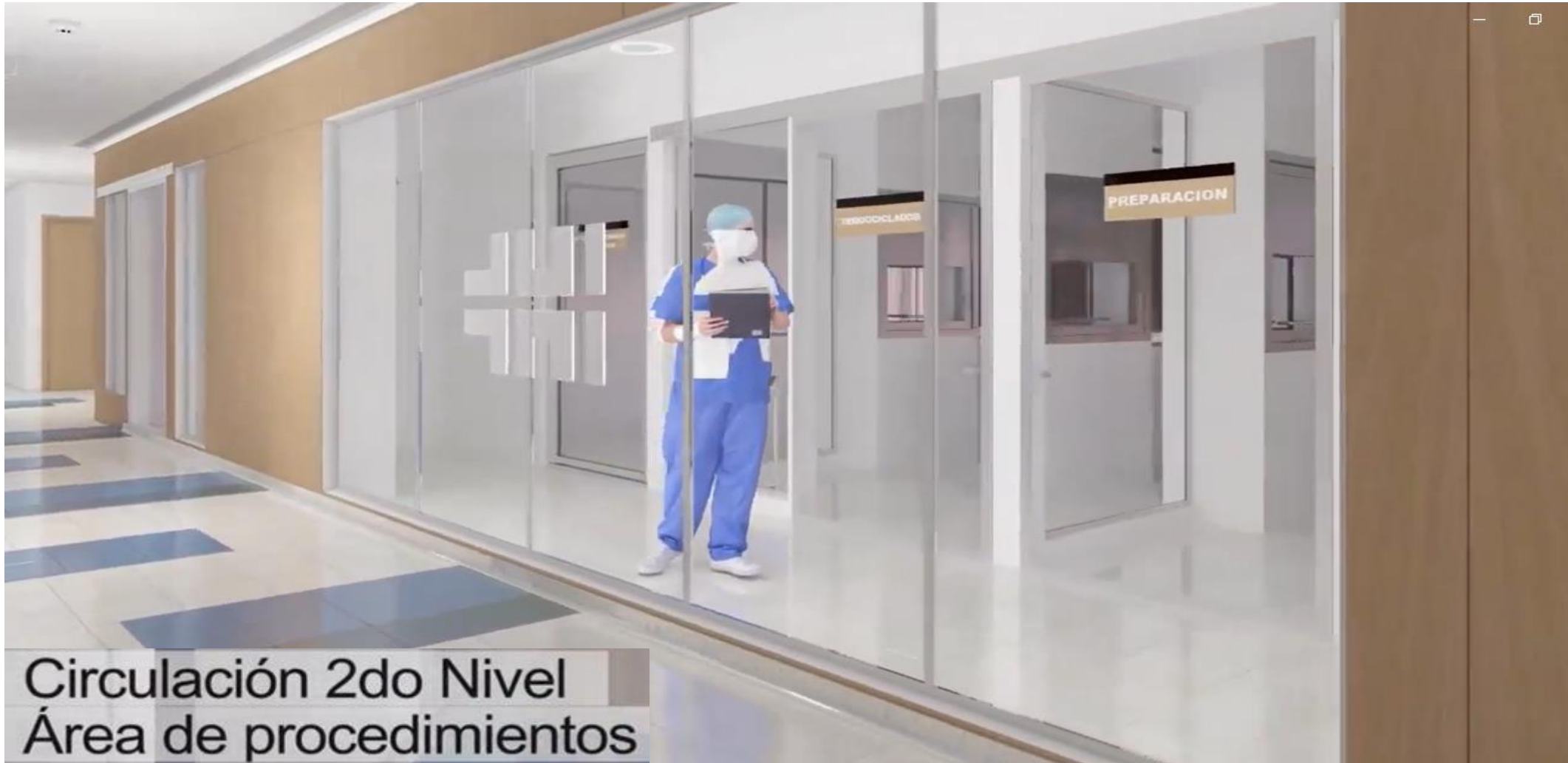
Circulación 2do Nivel Área de procedimientos