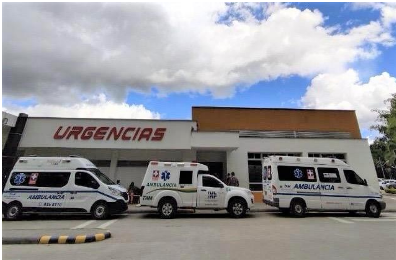
AMBULANCIAS PROPIAS DE LA E.S.E HOSPITAL DEPARTAMENTAL SAN ANTONIO DE PITALITO