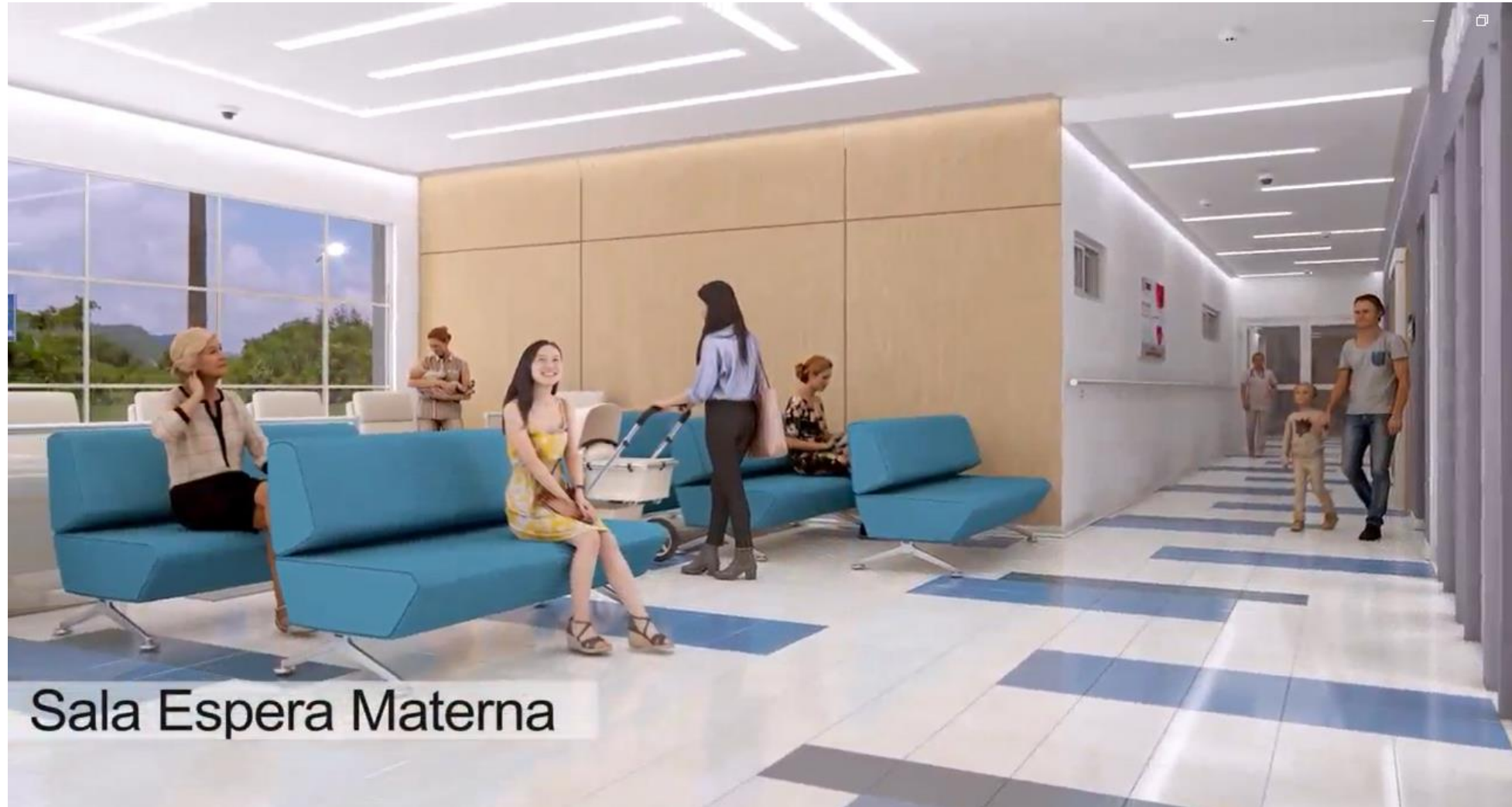
Sala Espera Materna